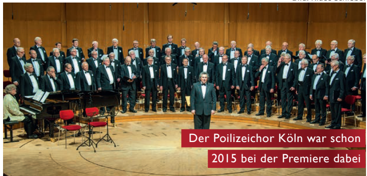
Der Poilizeichor Köln war schon 2015 bei der Premiere dabei