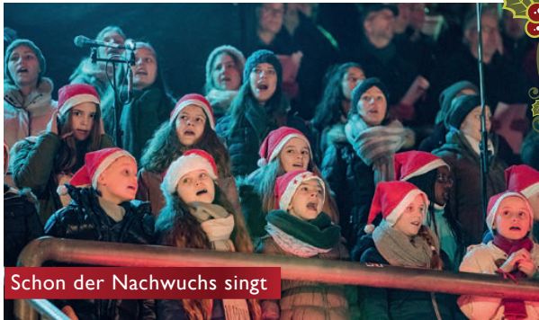
Schon der Nachwuchs singt