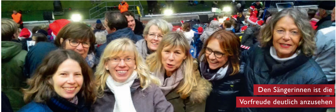
Den Sängerinnen ist die Vorfrende deutlich anzusehen