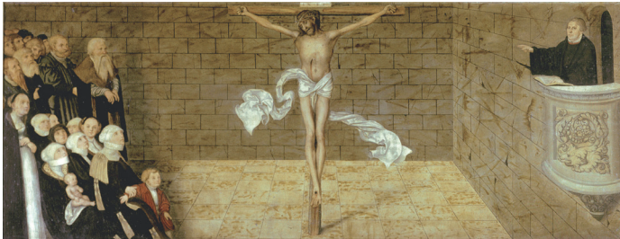
Abb. 6: Lucas Cranach d. Ä., Predella des Haupt-Altars der Stadtkirche St. Marien in Wittenberg, 1547: Luther malt der Gemeinde durch das mündliche, gepredigte Gotteswort den Gekreuzigten vor Augen.

Menschen an. In seiner Person ruft er Menschen zum Glauben auf. Menschen ihrerseits erzählen von diesem Wort. Sie verkündigen das Evangelium von Jesus Christus. Sie predigen über die Geschichten, die Menschen mit Jesus erlebt haben. Die Reformatoren waren überzeugt: »Wenn ... heute dieses Wort Gottes durch rechtmäßig berufene Prediger in der Kirche verkündigt wird, glauben wir, dass Gottes Wort selbst verkündigt und von den Gläubigen vernommen werde ...« 25