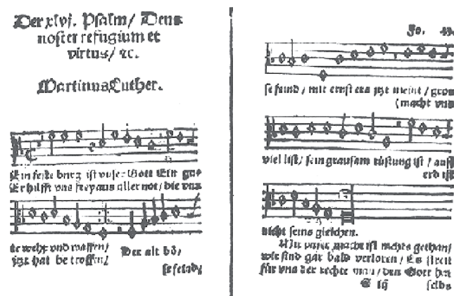
Abb. 8: Luthers »Ein feste Burg« nach dem Klugschen Gesangbuch, 1533

bewusstsein. Zudem spiegeln nicht wenige reformatorische Lieder und Psalmgesänge, die sich noch heute in den Gesangbüchern finden, diese fröhliche Zuversicht gegen alle Angst.