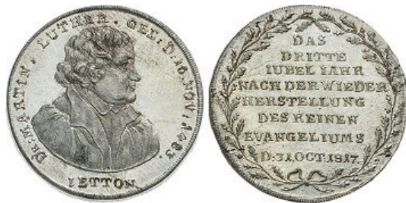
Abb. 7: Medaille auf das Jubiläum 1817, Nürnberg (Kunsthandel): »Das dritte Jubeljahr nach der Wiederherstellung des reinen Evangeliums, d. 31 Oct 1817.«

überraschend: Dass zum Beispiel im Jahre 1617 beim allerersten Jubiläum die Selbstbehauptung der neuen Konfession im Vordergrund stand und Luthers Thesenanschlag als theologische Großtat erzählt wurde, ist auch heute noch gut nachzuvollziehen. Dass 1817 das Jubiläum als nationales Einigungsfest gefeiert wurde, in dem Luther als erster großer Deutscher einen herausragenden Platz fand, ist auch nicht verwunderlich. Wie problematisch solche aktualisierenden Erzählungen allerdings sein können, zeigte das Jubiläum des Weltkriegsjahres 1917. Dieses Jubiläum wurde für die religiöse Überhöhung von Opferbereitschaft und die Steigerung des Durchhaltewillens der Bevölkerung funktionalisiert.