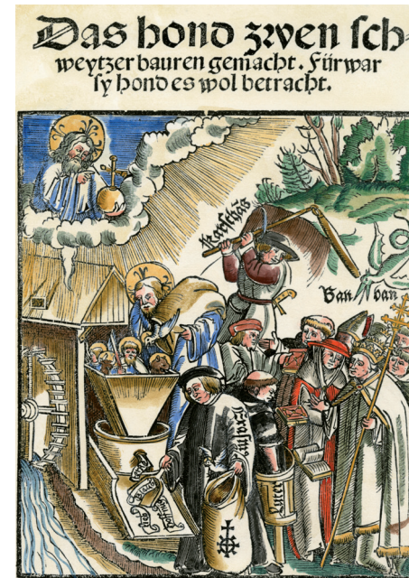
Abb. 2: Die göttliche Mühle (Zürich 1521)

gründete die Internationalität der Reformation durch seine Einbindung von französischen und anderen europäischen Traditionen. Ein Bewusstsein für die innere, auch theologische Einheit dieser Bewegung wird früh sichtbar gemacht, beispielsweise in einem Züricher Flugblatt des Jahres 1521, an dessen Entstehung Zwingli beteiligt war.