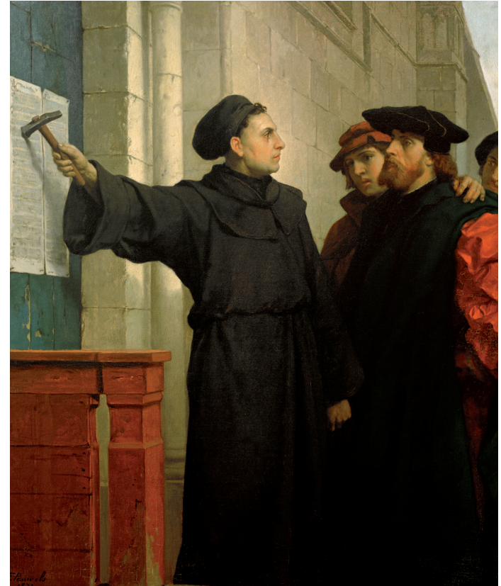
Abb. 1: Ferdinand Pauwels (1830–1904), Thesenanschlag

merkungen zu einem sakramentalen Vollzug der Kirche (präziser: zu einem Anhang des Bußsakramentes) zur Folge haben würden. Das klassische Bild im kollektiven Gedächtnis, auf dem ein kraftvoller Mann am Vorabend des Festes, also dem 31. Oktober 1517, mit entschlossenen Zügen und wuchtigen Hammerschlägen ein Thesenblatt an eine Kirchentür nagelt,