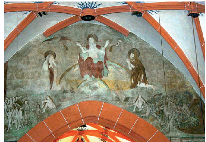
Abb. 4: Büdingen (Hessen), Fresko des Jüngsten Gerichtes im Chorbogen (um 1491)

Martin Luther hat sein Leben in weitgehend späten Rückblicken als Teil einer religiösen Leistungsgesellschaft gedeutet, in der durch eine besondere Intensität religiöser Leistung das Anrecht auf ein gnädiges göttliches Urteil im Endgericht verstärkt werden sollte. Aus seiner Korrespondenz mit seinem Beichtvater, Johann von Staupitz (1465–1524), wissen wir, dass Luther als Mönch in Erfurt so viele Sünden bei sich aufzuspüren suchte und beichtete, dass es diesem Beichtvater