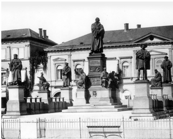
Abb. 3: Ernst Rietschel (1804–1861), Lutherdenkmal Worms (1868)

Die reformatorische Bewegung aber hätte sich nicht so rasant entwickelt, wenn nicht Landesfürsten des Reiches wie Friedrich der Weise oder Philipp von Hessen und die Bürgerschaften von Städten wie Zürich, Hamburg und Genf sie gefördert hätten. Festzuhalten bleibt jedoch: Es waren nicht nur diese Herrscher und Theologen, sondern ganze Netzwerke verbundener Männer und Frauen, die das reformatorische Zeitalter möglich machten und prägten. Das neunzehnte Jahrhundert gestaltet diese Einsicht in seinen monumentalen Denkmälern, beispielsweise im größten Reformations-Denkmal der Welt in Worms, auf dem neben den klassischen Reformatoren und den genannten Landesfürsten auch sogenannte Vorreformatoren wie Johannes Hus (um 1369–1415) dargestellt sind.